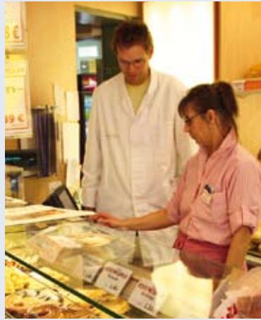
Die intuitiv bedienbare Benutzeroberfläche des Cash Pro-Kassensystems ist schnell erklärt.

gar den aktuellen Touchscreen einer beliebigen Kasse aus einer Filiale auf den eigenen Bürobildschirm holen, die Eingaben der Verkäuferin werden dabei in Echtzeit übertragen. Ebenso gut kann der Verwaltungsleiter aber auch auf die Kasse zugreifen und so beispielsweise einer Mitarbeiterin direkt auf dem Touchscreen den korrekten Ablauf eines Buchungsvorgangs erklären, ohne selbst vor Ort sein zu müssen. Um das Verkaufspersonal bei der Kundenberatung zu unterstützen, lassen sich im Kassensystem neben dem Preis z.B. auch Zutatenlisten, Verzehr Tipps oder Produktfotos hinterlegen.